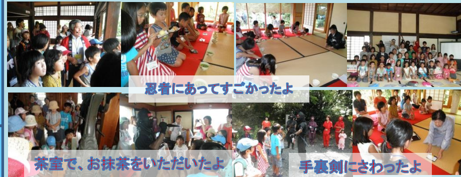
忍者にあつてすごかったよ