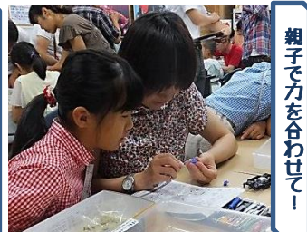
親子で力を合わせて！