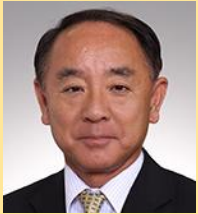
静岡県議会議員 東堂 陽一様

去年出来たばかりの新しい体育館です。子ども観光大使として魅力をたくさん勉強してほしいです。特にラグビーはエコパで9月からワールドカップがあります。世界中から日本中からお客様がやってきます。皆さんもそういう人たちと仲良くなっておもてなしをしてもらいたいです。