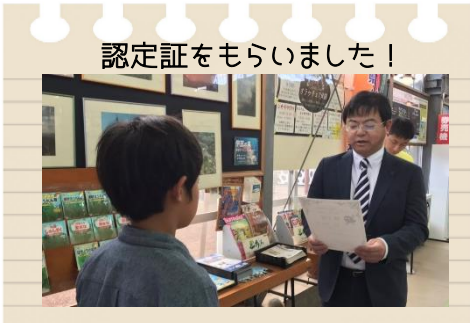
認定証をもらいました！

日時/2019年12月1日(日) 10:00~12:00 場所: 酪農王国オラッチェ