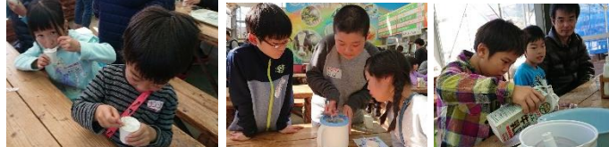
お手製アイスクリームおいしいよ そろそろできるかなあ 材料も慎重に入れるよ