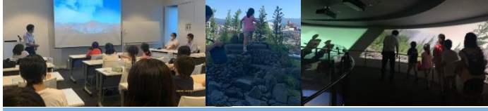
富士山がなぜ「世界文化遺産」なのか教えてもらったよ。 富士山岩に登ったよ。 登山体験。誰もいないのに登山者の影が見えるよ！

日時／2022年 9月11日(日) 10:00～12:00 場所： 静岡県富士山 世界遺産センター (富士宮市) 発行： NPO 法人子ども未来