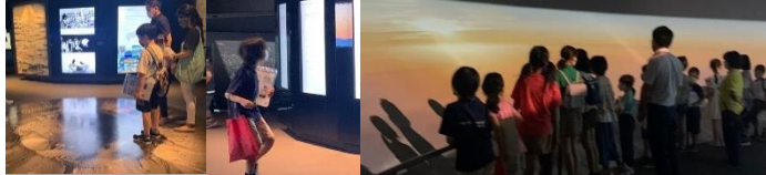
富士山の火口だよ！ クイズラリーに挑戦！ みんなで観光体験！ 朝日を見たよ！