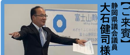
【ご来賓】 静岡県議会議員 大石健司様

その後、実際に、空港内でお話を聞かせていただきました。まずは、検疫、病気を持ち込まないために工夫されたアイテムの紹介、防護服体験をしました。次に、入国審査。四種類のパスポートの話、世界でもトップクラスの偽造防止の技術を実際に触って探しました。最後に税関。荷物に隠した違法な物をどのような技術で見つけるか、みんなで探す体験をしました。みんな夢中でお話を聞きました。