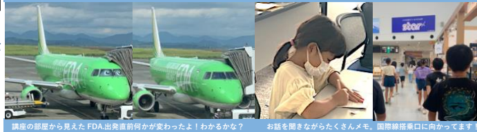
操縦の部屋から見えた FDA 出発直前何かが変わったよ！わかるかな？ お話を聞きながらたくさんメモ。国際線搭乗口に向かってます！